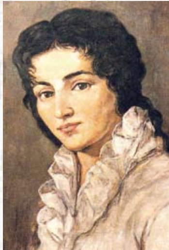
Constanze Mozart Gemälde von Gerhard Bassler. Original in der Mozartstube im Hotel Löwen

Constanze Mozart, geborene Weber – der Name der berühmtesten Tochter der Stadt Zell hat weltweiten Klang. Im Jahre 1762 wurde Constanze Weber in Zell im Wiesental geboren, 20 Jahre später heiratete sie Wolfgang Amadeus Mozart. Ihr zu Ehren hat die Stadt Zell einen Constanze-Mozart-Boulevard in der Innenstadt verwirklicht. Auf zwölf Steinplatten, eingebettet in das Pflaster der Gehsteige, sind die wichtigsten Lebensdaten Constanze Mozarts vermerkt. Das ist der historische Aspekt des Boulevards. Die künstlerische Intention betont den interaktiven Moment: Wer die relativ große Schrift auf den Platten im Detail lesen will, muss sich nämlich etwas vorbeugen und den Kopf leicht neigen. Dergestalt wird diese kleine Geste der Passanten im öffentlichen Straßenraum zu einer fast unscheinbar wirkenden Verbeugung vor einer wahrhaft großen Frau, ohne die das Werk Wolfgang Amadeus Mozart in der jetzigen Form nicht zu erhalten gewesen wäre. So gesehen ist der Boulevard, der bei gemächlichem Rundgang in circa 30 Minuten betrachtet werden kann, als eine dauerhafte Hommage an Constanze Mozart zu verstehen.